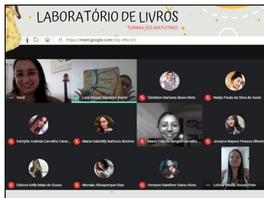
Imagem 02 – Sala virtual