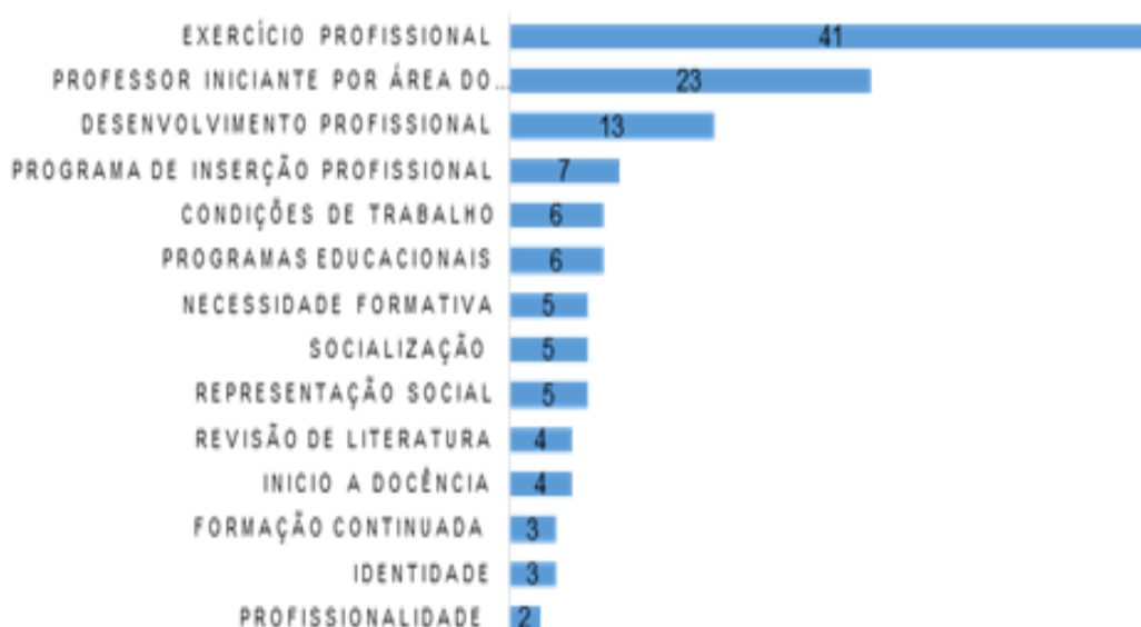
Gráfico 02 - Categorias das pesquisas sobre professor iniciante

Dos 127 trabalhos sobre o professor iniciante, produzidos de 2003 a 2016, temos a seguinte distribuição de categorias no gráfico 2: